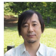
サブリーダー 国立研究開発法人 情報通信 研究機構 (NICT) 株式会社 洋三